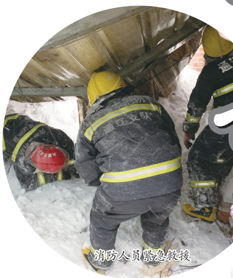
消防人员紧急救援