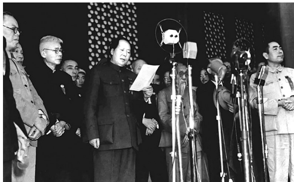
1949年10月1日下午3时,毛泽东主席宣读《中华人民共和国中央人民政府公告》。

为了铭记,也为了传承,新华社编辑推出了《新华通讯社90年90篇精品选》。以时间为脉络,收录了新华社记者在中国革命、建设、改革各个历史时期采写的90篇新闻作品。翻开这些名篇,仿佛可以