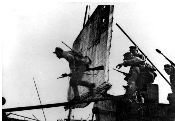
1949年4月21日,人民解放军强渡长江。