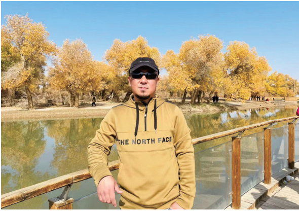
在额济纳疫情暴发前和胡杨林的合影