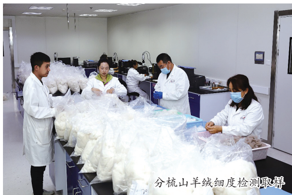
分梳山羊绒细度检测取精