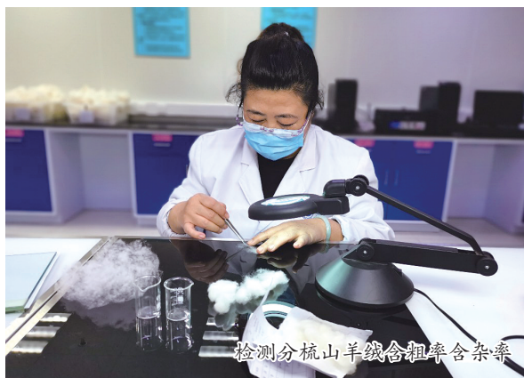
检测分梳山羊绒含粗率含杂率