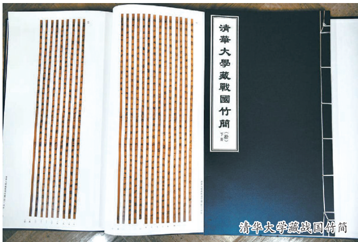
清华大学藏战国竹简

近日,清华简的最新研究成果引起人们热议,其中有研究指出,蚩尤竟然是黄帝之子。黄帝战蚩尤,是人们最熟悉的中国神话故事之一,这一发现如果属实,那么便极大地颠覆了人们的认知。