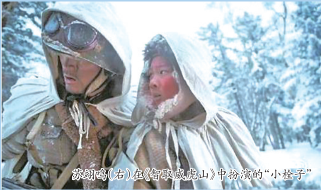
苏翊鸣(右)在《智取威虎山》中扮演的“小栓子”

12月5日,17岁的单板小将苏翊鸣在自由式滑雪大跳台世界杯美国斯廷博特站中,以出色的发挥拿下金牌。这是中国单板滑雪在大跳台项目上的第一个世界杯分站赛金牌。