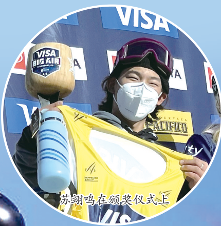
苏翊鸣在颁奖仪式上