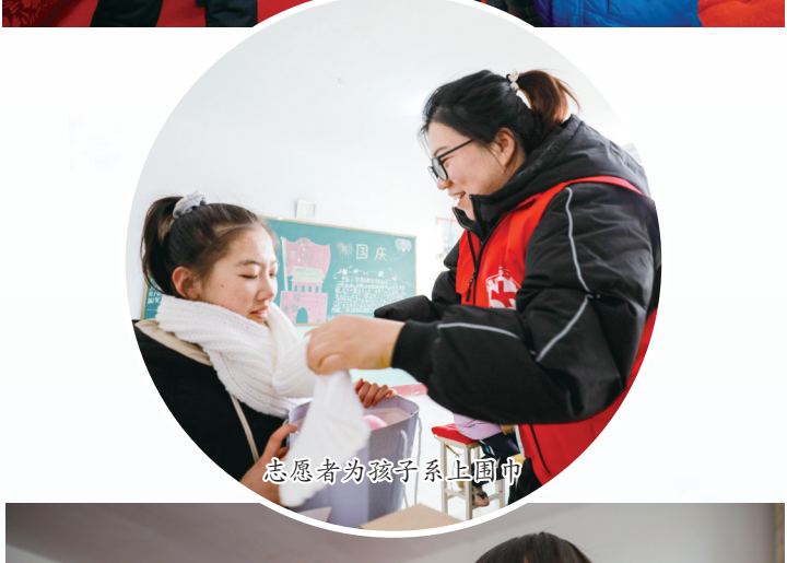
志愿者为孩子系上围巾