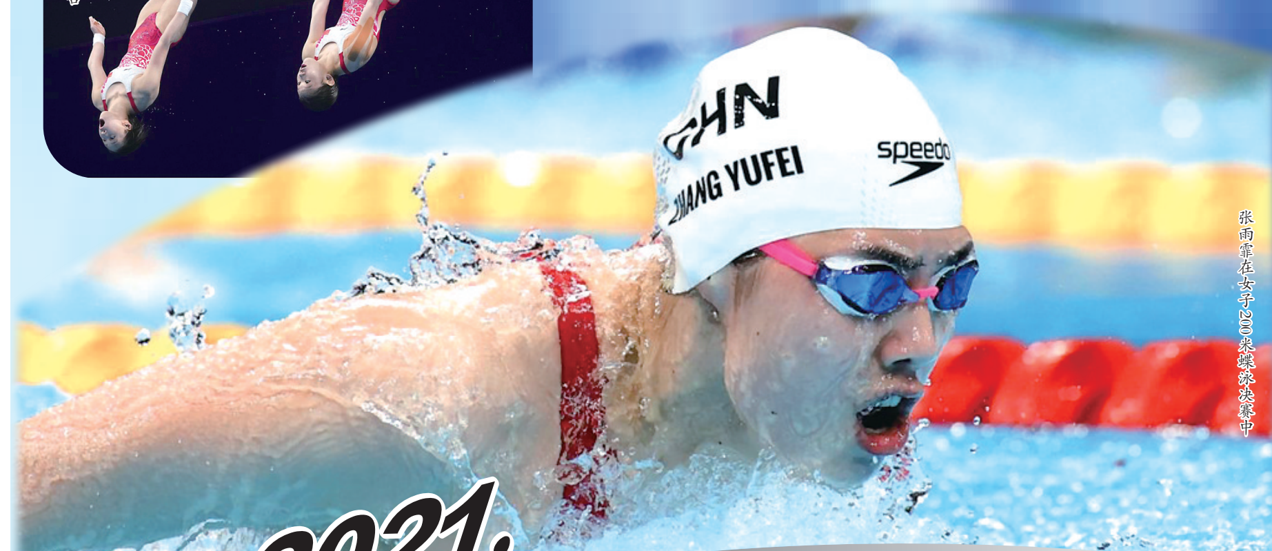
张雨霏在女子200米蝶泳决赛中