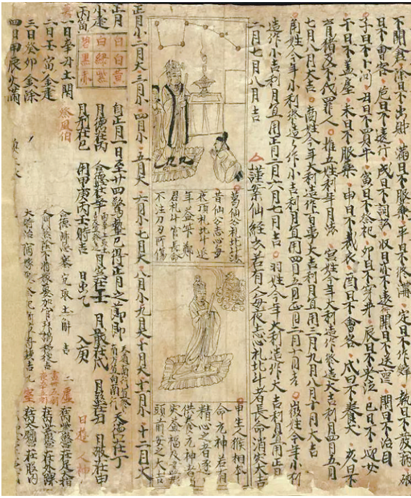
后唐同光二年甲申岁(924年)具注历日

比如在敦煌卷轴中,就有后唐同光二年甲申岁(公元924年)的具体注历日。这个历书的内容相当丰富,前面有年九宫图、年