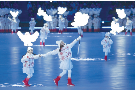
这是开幕式上的“雪花”环节