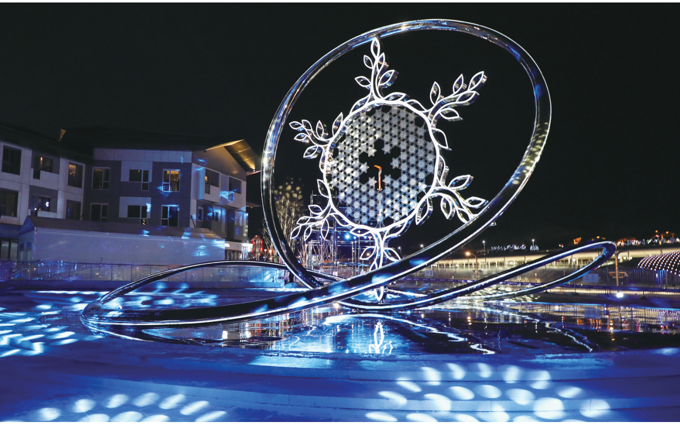
这是位于张家口赛区的北京冬奥会火炬台

北京冬奥组委开闭幕式工作部部长、国家体育场运行团队主任常宇介绍说,有约15000名观众来到“鸟巢”,与演员、奥林匹克大家庭成员和运动员一起参加开幕式。 (姬 烨 高 萌)