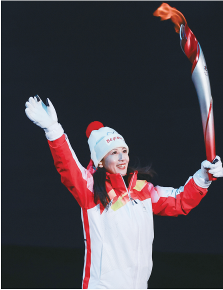
这是火炬手杨扬在开幕式上传递火炬

新华社消息 北京冬奥会开幕式上,以“不点”代替“点”的点火方式,给观众留下了深刻的印象。5日,总导演张艺谋在接受新华社记者采访时表示,原来还设计了一个更大胆的点火方案,就是采用“无火”的方式。 张艺谋说,开幕式上的点火方式充分体现了中国的文化自信,在科技和文化创新的理念中体现了中国人的价值观。此前,开幕式团队还设计了一个更大胆的点火方案,就是采用“无火”的方式。因为在奥林匹亚采火时,每一次都是用太阳光聚焦采火,自己就想到如何回归初心,把火还给太阳,因此当时有一个创意就是用一束光代替火。 “我认为那个创意更大胆,当时这两个创意都报给北京冬奥组委,都得到了支持和肯定。从批准这两个方案,我看到了文化自信。”张艺谋说:“后来我们不说‘AB’方案,都报给了国际奥委会,经过反复讨论,他们觉得‘光’的立意非常好,但可能还没有想好未来是否采用‘无火’,毕竟火还是象征,就保留了微火的方案。” 张艺谋认为,我们的文化自信、国家发展和精神面貌都凝聚在这样的设计理念上,在科技和文化创新的理念中,体现了中国人的价值观,体现了低碳环保的理念。“文艺表演可能会逐渐淡化,但主火炬台和点火方式会载入史册,这是中国的创新之处。”他说。 开幕式让所有人再一次见证了“中国式浪漫”。张艺谋表示,中国人非常讲意境,含蓄内敛带来了更深远意境和诗情画意,是中国人浪漫最大的不同。主火炬,让所有参赛国家的小雪花簇拥着,通过没有点火的“留白”,回到了生命生生不息的初心。 张艺谋说,自己看了网友们很多评论意见,“我没有想到,中国人比我想的还要浪漫”。 (郭宇靖 王修楠)