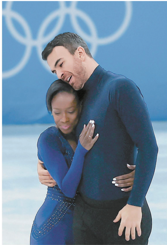
▲花样滑冰团体赛双人自由滑比赛,加拿大选手瓦妮萨·詹姆斯(左)、埃里克·拉德福德拥抱互勉。