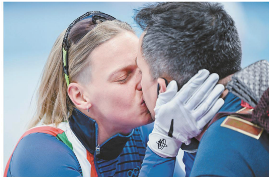
▲短道速滑女子500米决赛后,冠军意大利选手阿里安娜·方塔纳(左)激动庆祝。

奥运会是短暂的,但友谊地久天长。我们相信,冬奥赛场上还将留下更多笑脸、更多拥抱、更多温暖。那些真情流露,润滑了分秒不让的竞技场面,让我们感到运动极限与人性之光共同闪耀。(据《冬奥会刊》)