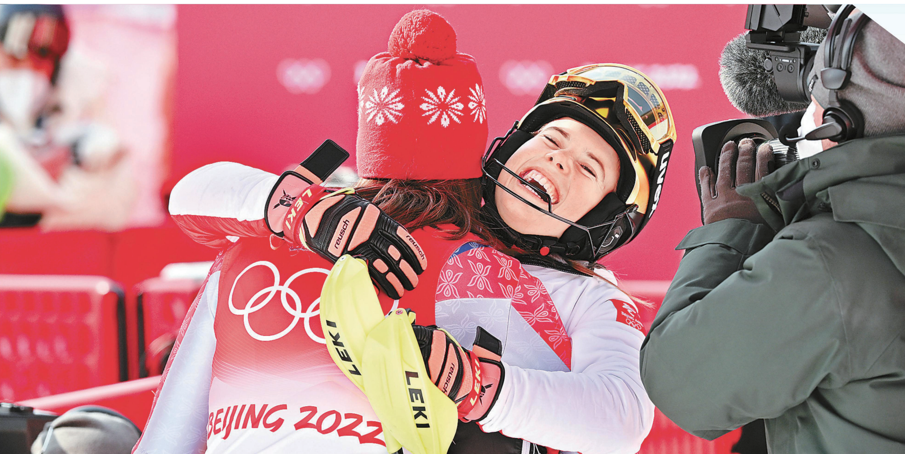
▲高山滑雪女子回转比赛,银牌得主奥地利选手卡塔琳娜·林斯伯格(左二)与该项目金牌得主拥抱庆祝。