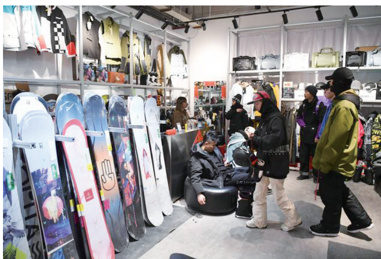
2月22日,滑雪爱好者在陕西省太白县鳌山滑雪场一家商店内购买滑雪装备。

步推进。高技术制造业、装备制造业PMI分别为53.1%和51.4%,高于上月1.2和1.1个百分点,新动能继续发力;消费品行业PMI为51.8%,高于上月1.6个百分点,假日消费带动作用明显;高耗能行业PMI为48.3%,低于上月1.4个百分点,高耗能行业景气水平低位运行。