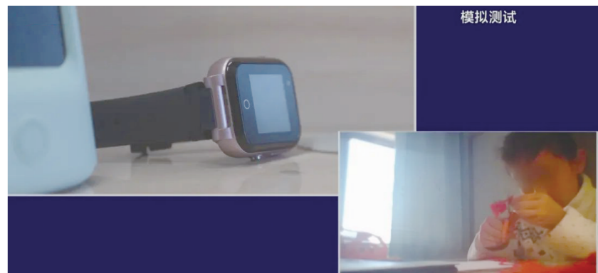
在模拟测试中,工程师对一款儿童手表远程控制,可以看到孩子放学在书桌前做手工。

很多用户在想要安装软件的时候,可能会去一些专门的软件下载站。但经常多了不需要的软件,莫名其妙出现一些弹窗广告,甚至电脑变得有些卡顿。这些软件和弹窗广告是怎么进入我们电脑里的呢? 记者在PC6下载站、桔梗下载站、腾牛网、ZOL软件下载等平台下载软件时都出现类似的问题,这些下载平台,使用的是百助旗下公司研发的下载器,它们都有一个绿色的、很显眼的高速下载选择,下面还有一行小字提示:提速50%,需下载高速下载器。 而在调查采访中,百助公司销售部业务经理却告诉记者,这个所谓的