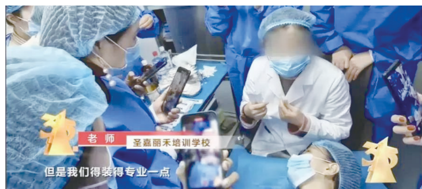
圣嘉丽禾南京校区微整形全科培训班上,老师在为学员培训。

如今儿童智能手表几乎成了孩子们的“标配”,借助它,家长可以方便地与孩子沟通、掌握孩子行踪。不少低配版的儿童智能手表在各大电商平台畅销热卖,315信息安全实验室对此展开了专门的测试。工程师选取一款有着10万+销售记录的儿童智能手表,将一个恶意程序植入到智能手表中,实现了对手表的远程控制。工程师可以对孩子实时定位,不间断收集孩子的移动轨迹,轻松圈定孩子的活动范围,甚至可以判断出:孩子的家离学校很近,5分钟就能走到;还能实时听到孩子和家人的聊天内容、看到孩子放学在书桌前做手工。 为什么儿童智能手表会成为一双时刻偷窥的眼睛?测试人员发现,根本原因就在于它的操作系统过于老旧。这款手表使用的是没有任何权限管理要求的安卓4.4操作系统,距今已将近10年,而操作系统最新版本已经更新到了安卓12。厂家出于压低成本的考虑,选用低版本的操作系统,这意味着在这样的儿童手表上,各种App安装后,无需用户授权就可以开启多种敏感权限,轻易获得孩子的位置、人脸图像、录音等隐私信息,孩子的安全隐患可想而知。