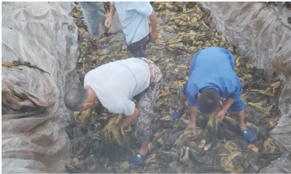
在腌制酸菜的土坑里,工人们有的穿着拖鞋,有的光着脚,踩在酸菜上。

2022年央视“3·15”晚会15日晚播出,今年的主题是“公平守正 安心消费”,包括直播、手机App、食品、医美等多领域乱象遭曝光。直播领域曝光的乱象包括男运营假冒女主播骗粉丝打赏、翡翠直播间借高价原石发廉价成品。食品方面曝光了部分老坛酸菜包实为土坑腌制、部分禹州红薯粉条使用木薯粉等。此外,今年的“3·15”晚会首次设立315信息安全实验室,曝光了“免费WiFi”App暗藏陷阱、低配儿童电话手表成行走的偷窥器问题。