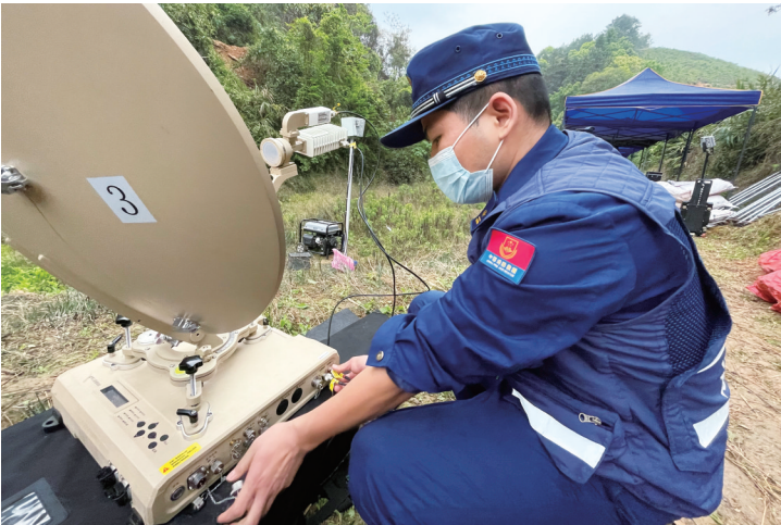
3月22日,工作人员在东航MU5735客机坠毁事故救援现场架设通信设备(手机照片)。

在坠机的核心区域,记者看到,飞机残骸和物品碎片散落在山谷中,一片狼藉,空气中仍然弥漫着一股刺鼻的味道。搜救人员在开展拉网式搜索,并对相对大件的残骸进行标记,黑色的数字在白色的标记卡片上,格外刺眼。