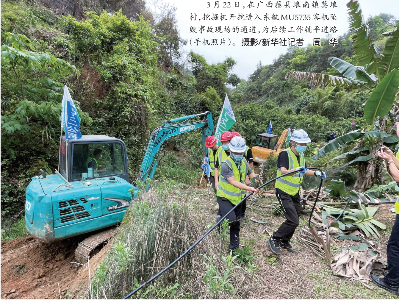
3月22日,在广西藤县埌南镇莫垠村,挖掘机开挖进入东航MU5735客机坠毁事故现场的通道,为后续工作铺平道路(手机照片)。