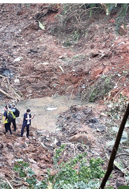
这是东航MU5735客机坠毁事故现场(3月22日摄,手机照片)。