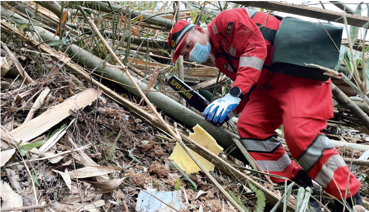
3月22日,工作人员在坠机事故现场搜索黑匣子(手机照片)。

记者从23日的新闻发布会上获悉,东方航空公司MU5735航班的一部黑匣子已于23日被发现。