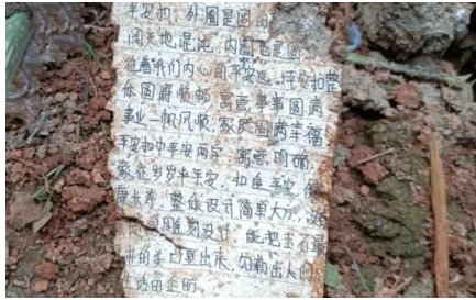
搜救人员发现失联人员随身物品