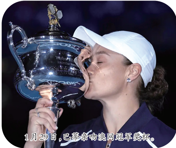
1月29日，巴蒂亲吻澳网冠军奖杯。

3月23日，现WTA世界第一、3个大满贯得主巴蒂突然宣布退役。巴蒂表示，去年温网夺冠后，便萌生了离开的想法，年初澳网夺冠后更坚定了退役的念头。巴蒂说，网球是她生命中最重要的一部分，但现在该去享受下一阶段的旅程了。