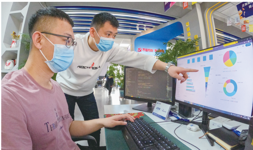
进行软件设计开发