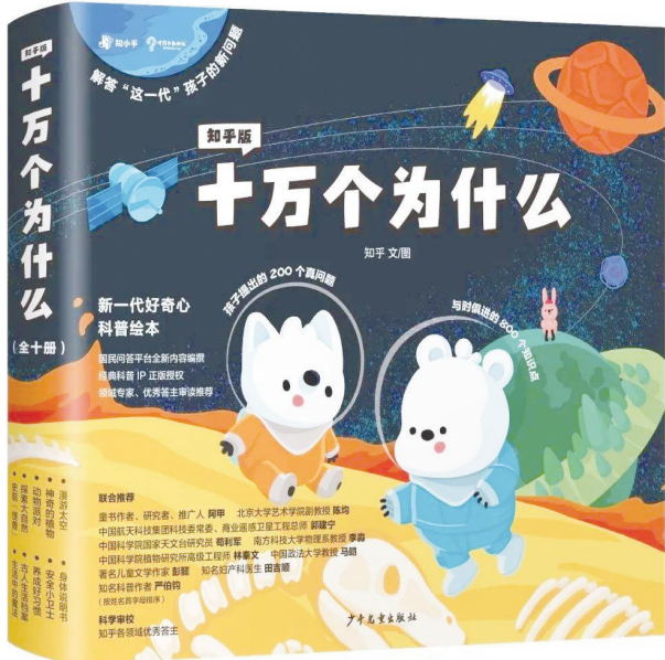
《十万个为什么》(全10册) 上海少年儿童出版社

好奇心是人类最值得珍视的财富，好奇心驱动着我们不断探索和发现更大的世界。这一代孩子，比以往任何时代拥有更多信息和知识，也萌发着更多更新的问题。新的“为什么”，需要新的解答。时值少儿经典科普《十万个为什么》出版60周年，知乎携手上海少年儿童出版社推出全新《知乎版十万个为什么》，解答“这一代”孩子的新问题。编者收集了当代孩子的真问题，邀请各领域机构和专家为孩子们写下新答案，其中有为什么扫地机器人不会迷路？宇宙飞船里面的电能从哪里来？它不是单个知识点的科普，每个知识点都是多学科的延伸。 （据《北京晚报》）