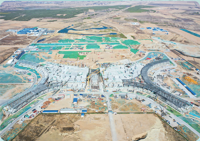
呼和浩特新机场建设现场