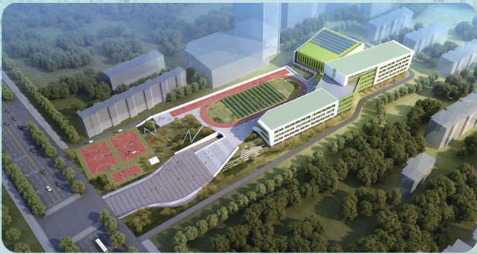
呼和浩特新建第二十七中学效果图