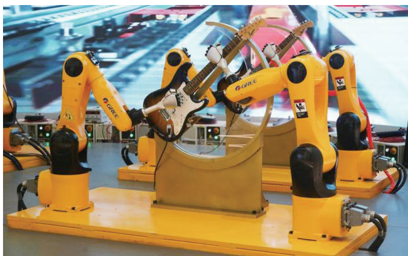
在位于赣州市的格力小镇，机器人乐队正在演奏音乐。

寻求补救，关键是要在300天内完成主厂区交付。为难之时，政企圆桌会议当即启动，环评、电力等部门干部下了桌直奔现场，高效推动厂房建设。