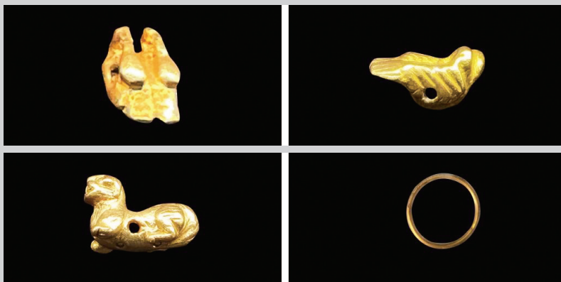
苏州虎丘路东吴家族墓中出土的金质比翼鸟、交颈鸟、虎造型串饰与指环。