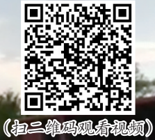
(扫二维码观看视频)

考试疫情防控措施如遇形势变化会适时调整,请考生密切关注呼和浩特市疫情防控部门发布的有关信息以及内蒙古招生考试信息网发布的有关考试防疫要求,做好赴考准备。