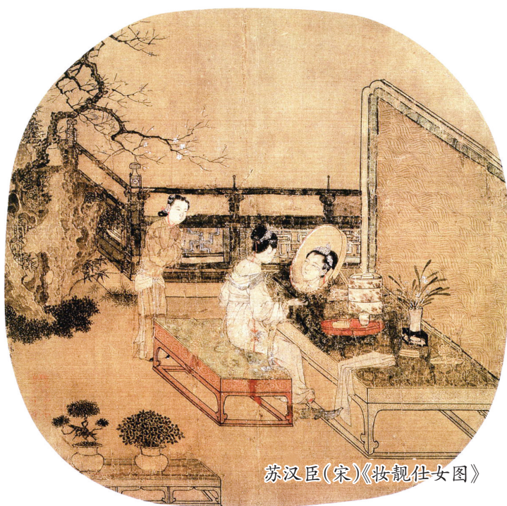
苏汉臣(宋)《妆靓仕女图》

顾恺之的《洛神赋图》,画作中的故事场景以及洛神的形象将曹植的《洛神赋》完整而又和谐地呈现出来,细观洛神的形象,“肩若削成”