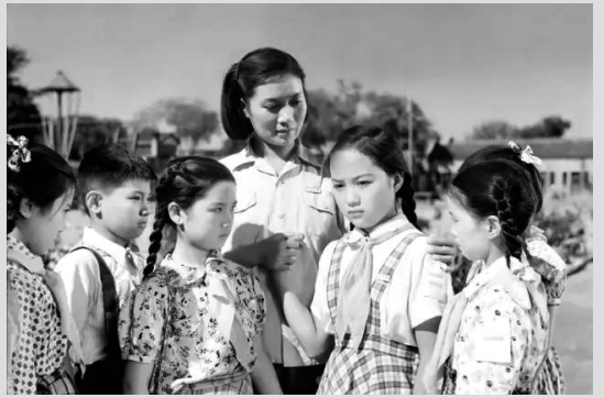
电影《祖国的花朵》剧照