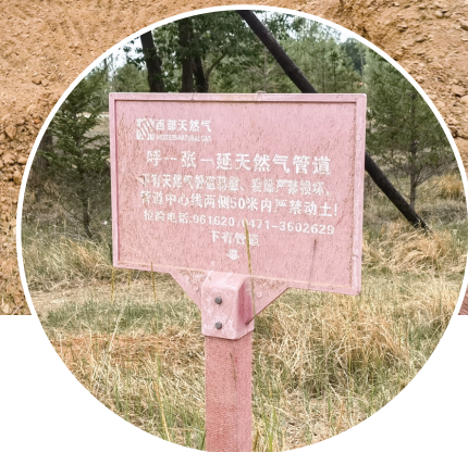
大坑附近立着的天然气管道警示牌

窑旧址是标准的工矿建设用地,不管是修建停车场还是建设旅游服务中心,都应该归国土部门审批。而在修建过程中是否占用村民基本农田,需要国土部门进一步鉴定。如果耕地确实非农化非粮化,我们会让他们立刻恢复耕地。但