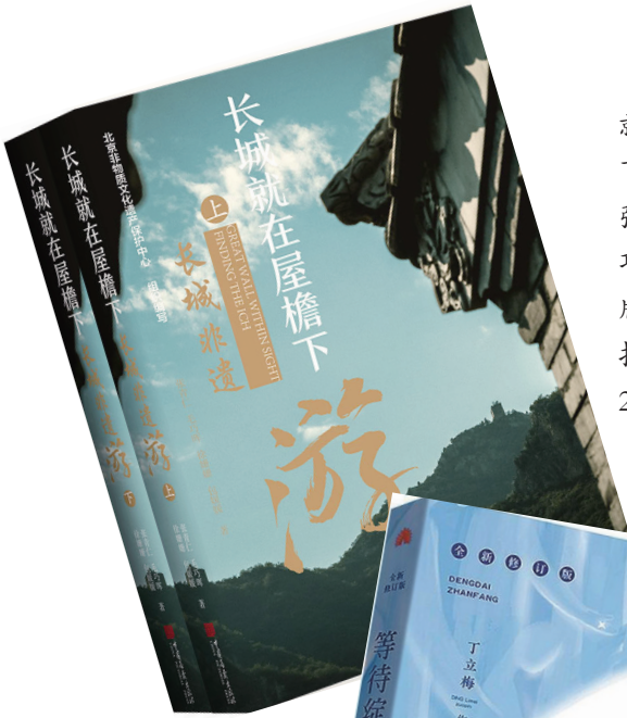
《长城就在屋檐下》作者:张青仁 毛巧晖等 出版:中国画报社 2021年版

《长城就在屋檐下:长城非遗游》全书共计50余万字,收录近400幅照片和手绘图,以非遗为主线,在长城沿线的时空脉络中,以长城墙体遗存线为线索进行创作。每段根据实际情况,选取其中文化、旅游、自然风貌等各种资源丰富的、更有文化挖掘价值、旅游发展潜力的点和路段来描写,或展现长城的雄奇秀美,或品味村落的古朴典雅,以全新的方式带领读者深入了解长城沿线的非遗和文化之美。(据《西安晚报》)