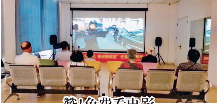
居民在社区影院观看电影