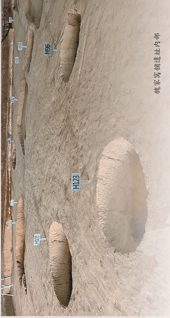
魏家窝铺遗址内部