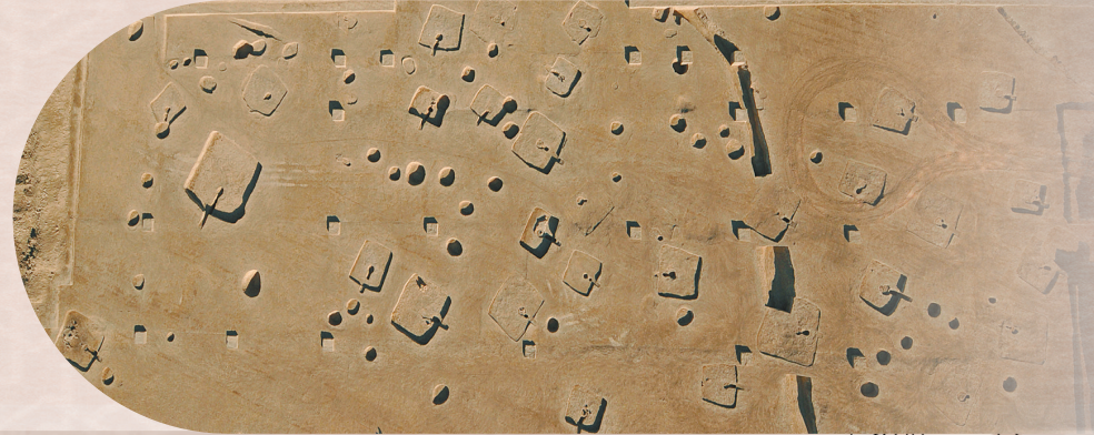
魏家窝铺 遗址2010年发 掘区航拍。