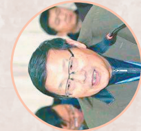
王颀(中国社会科学院学部委员历史学部主任、中国考古学会理事长、研究员)

红山文化是史前时期非常重要的一支文化,它是连接中国的中原地区和东北地区的一个桥梁。同时,也应该是东北亚地区史前时期最为发达的一支遗址文化。