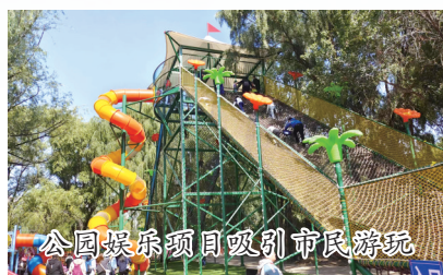
公园娱乐项目吸引市民游玩

不少旅行社都推出了国庆周边游项目,也有一些旅行社暂停了接团业务,选择错峰出游,也有