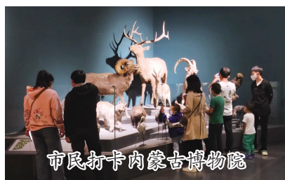
市民打卡内蒙古博物院

小时核酸检测阴性证明、出示预约时使用的证件原件、青城码、行程码并进行体温检测、安全检查、佩戴口罩方能入馆参观;内蒙古科技馆入馆时,需出示本人身份证原件和青城码,核验无误后刷身份证入馆;内蒙古自然博物馆、