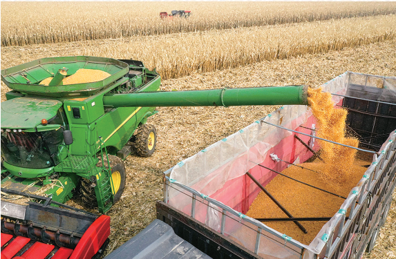
农机轰鸣收获无数金色希望