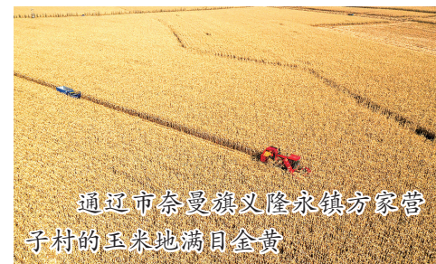
通辽市奈曼旗义隆永镇方家营子村的玉米地满目金黄