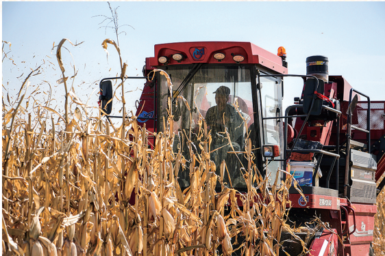
丰收的喜悦荡漾在每个人心头