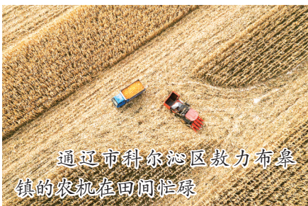
通辽市科尔沁区敖力布皋镇的农机在田间忙碌