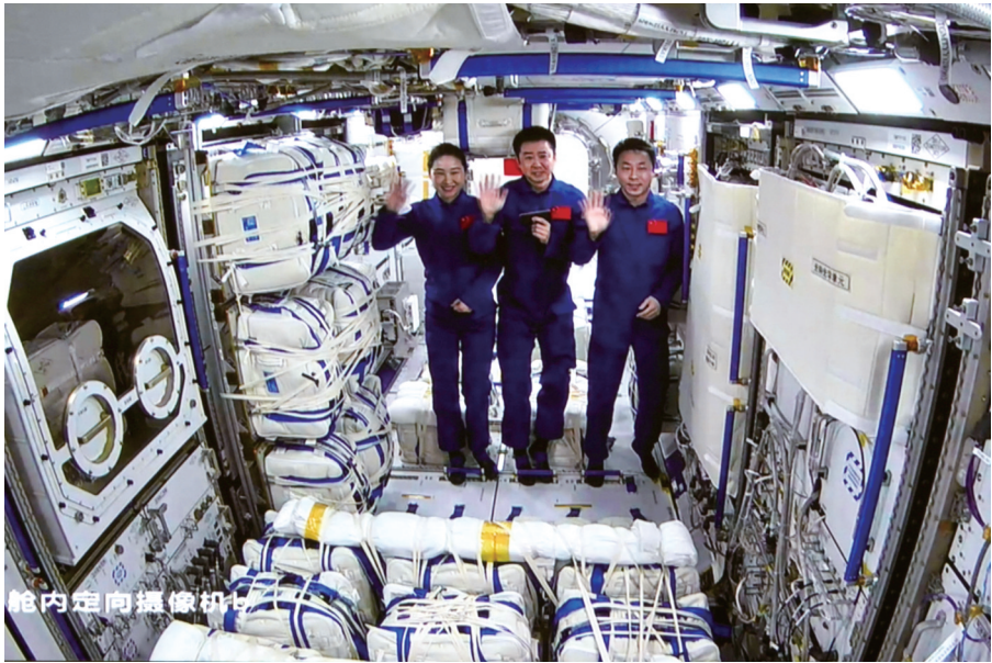
11月3日在北京航天飞行控制中心拍摄的神舟十四号航天员陈冬(中)、刘洋(左)、蔡旭哲进入梦天实验舱。

分离,之后采用平面转位方式经约一小时完成转位,与天和核心舱节点舱侧向端口再次对接。 梦天实验舱转位完成标志着中国空间站“T”字基本构型在轨组装完成,向着建成空间站的目标迈出