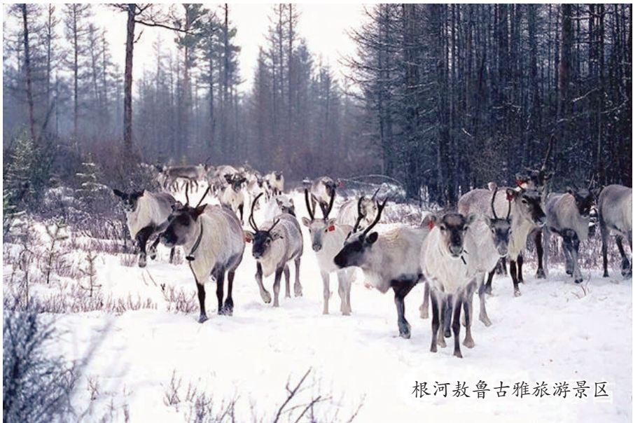
根河敖鲁古雅旅游景区