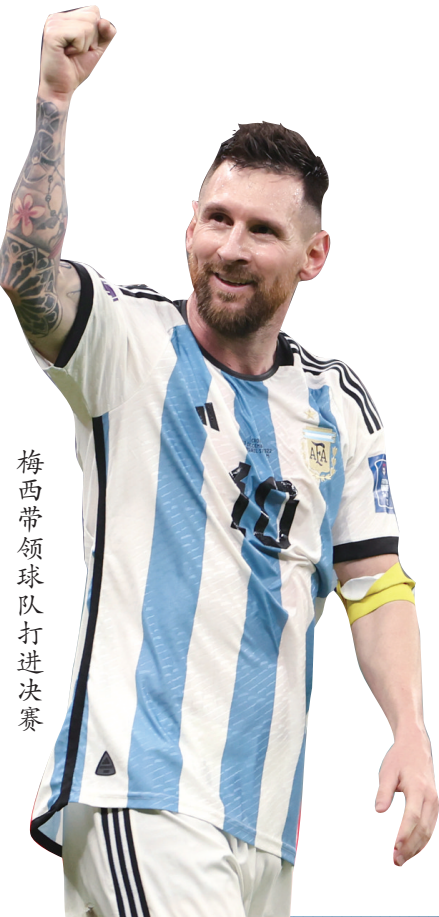
梅西带领球队打进决赛

打进对阵克罗地亚一役的点球后,梅西代表阿根廷取得的世界杯进球达11粒,超过巴蒂,独居阿根廷队史第一。卡塔尔世界杯决赛将是梅西第26场世界杯比赛,也将超越马特乌斯的25场纪录。已经单届打进5球的梅西如果决赛再进球,将超越1986年的马拉多纳。