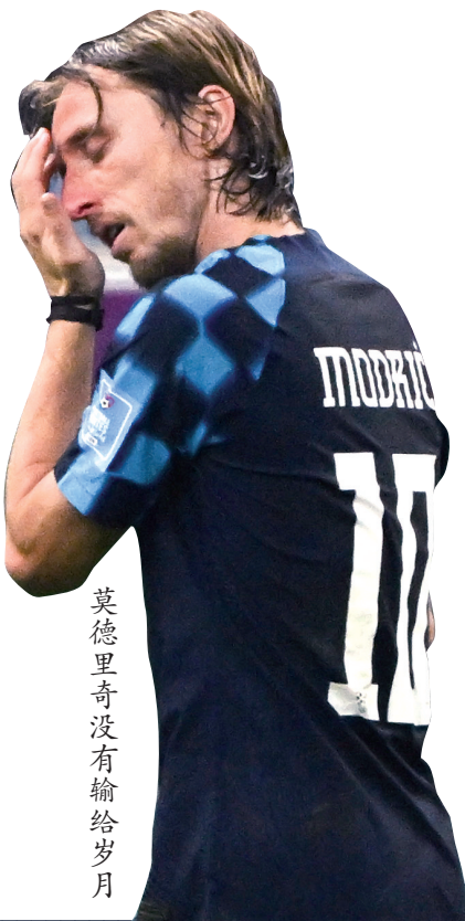
莫德里奇没有输给岁月

莫德里奇是坚强的。终场哨响,提前被换下的他没有流泪,只是呆呆地站着,半天一言不发。也许,他内心的痛苦,并不愿轻易向外人展露;也许,0:3的比分过于悬