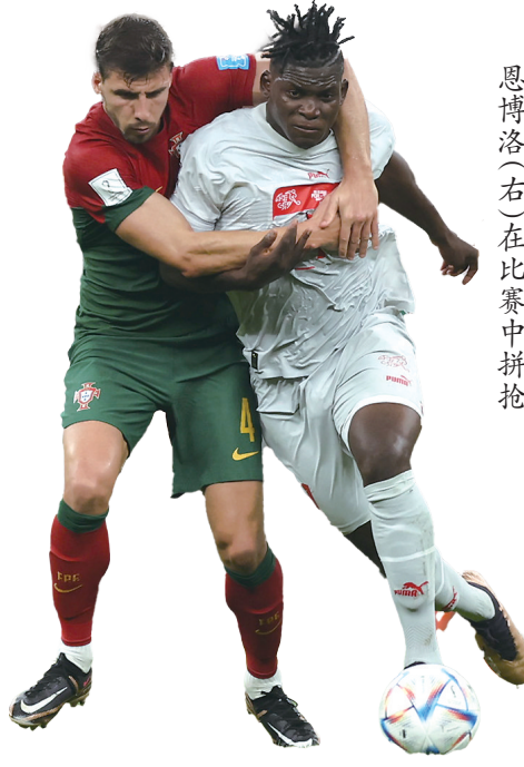
恩博洛(右)在比赛中拼抢

父亲是孩子最坚强的后盾，无所不能的“神”。当赛场上无坚不摧的硬汉卸下铠甲，就会把最温柔的一面给予孩子。（据新华社报道）