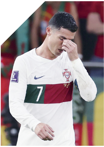
C·罗就此告别世界杯