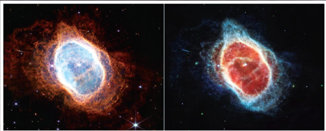
这是美国航天局7月12日公布的詹姆斯·韦布空间望远镜拍摄的宇宙图像

从7月发布第一张全彩宇宙深空图像,到发现遥远星系和太阳系外行星大气层,人类望向宇宙的“深空巨眼”——詹姆斯·韦布空间望远镜在2022年屡次登上天文学报道头条。