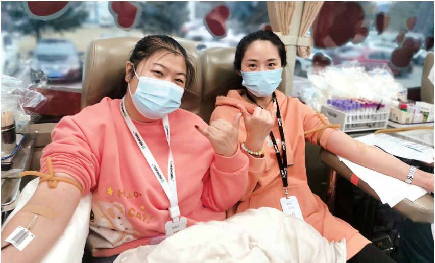
蒙牛的标志性手势动作「中国牛」

今年，北方新报社与内蒙古自治区血液中心继续联合开展“无偿献血公益联盟”宣传活动，邀请企事业单位、大中专院校、社会团体、公益组织以及爱心人士加入，联盟将汇集更多社会力量，为呼和浩特地区临床用血提供更多的血液储备。内蒙古血液中心爱心邀约热线：0471-4212330；北方新报社爱心邀约热线：18686032799。