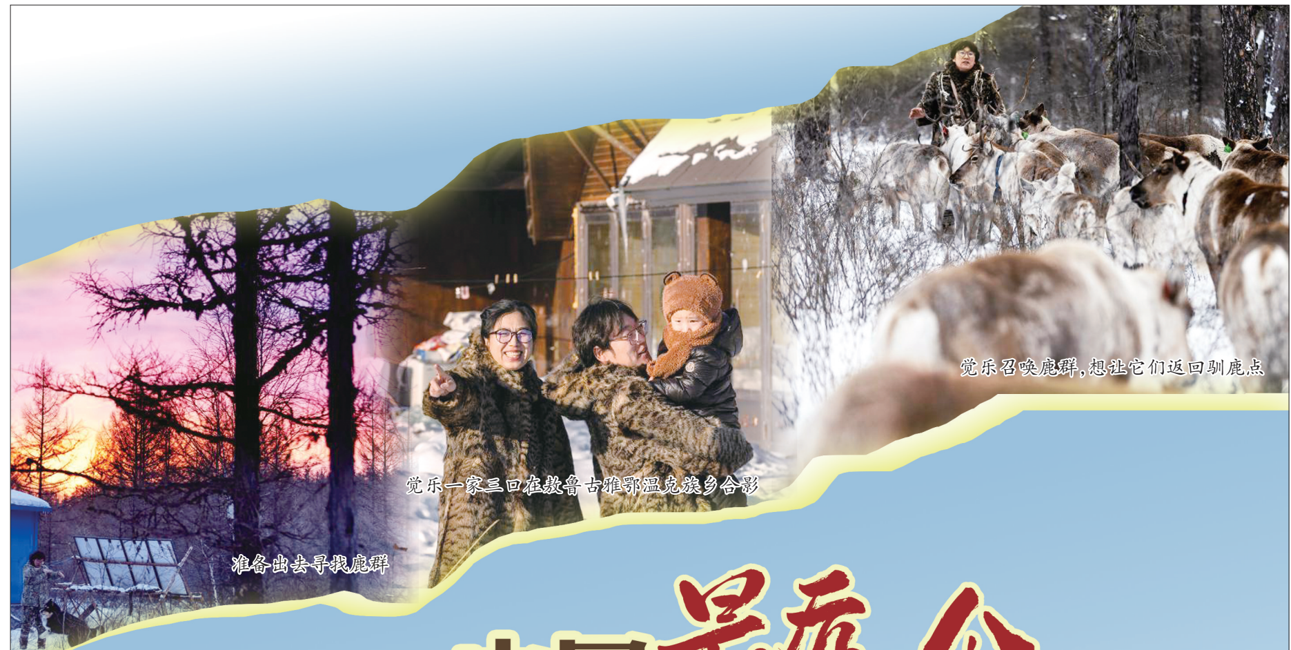
准备出去寻找鹿群