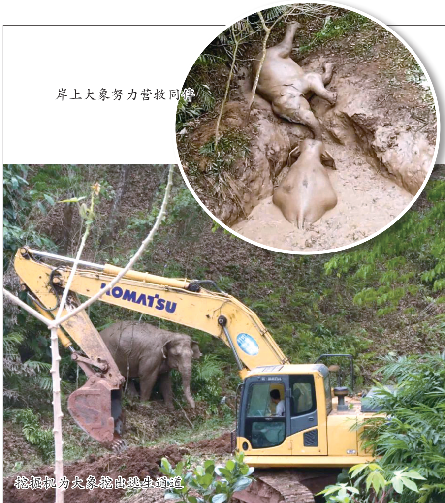
岸上大象努力营救同伴