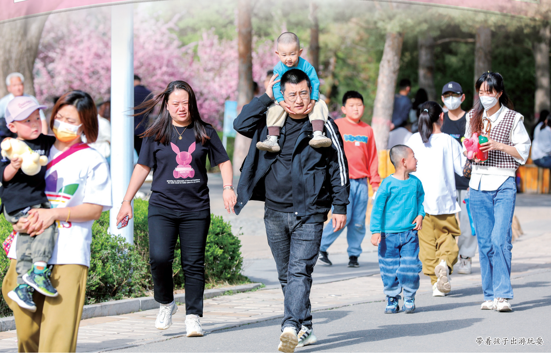
带着孩子出游玩耍