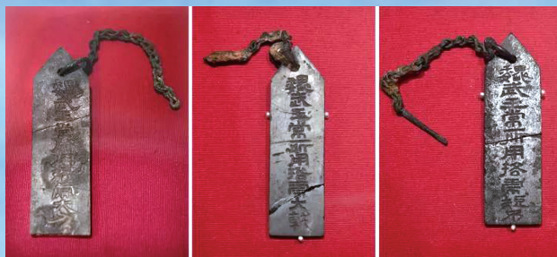
“魏武王常所用格虎大戟”等三块石牌