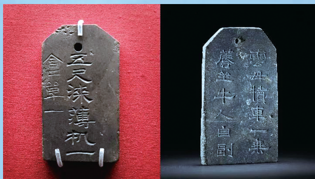
左:曹操墓出土的刻铭石牌 右:洛阳西朱村曹魏大墓出土的刻铭石牌