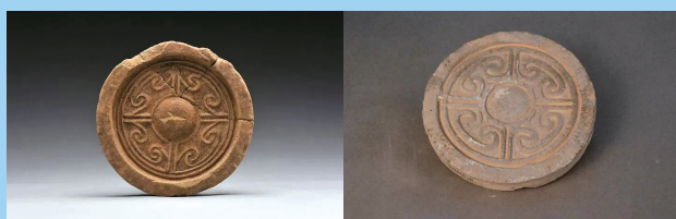
左:高陵陵园出土的瓦当 右:洛阳白草坡东汉帝陵陵园出土的瓦当