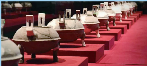
曹操墓出土的陶鼎