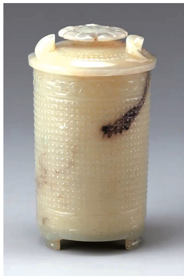
西汉勾连涡纹玉卮(zhī)(附盖)

透过这件小小的玉卮,我们窥见了汉朝独特的传统文化。“对酒当歌,人生几何”一起为更美好的生活干一杯吧。 (据央视报道)