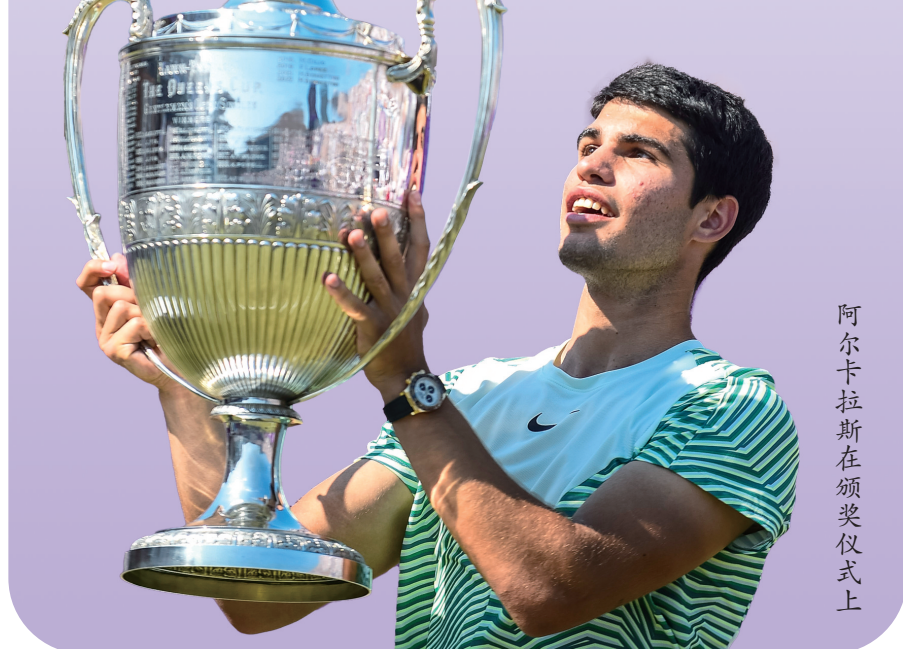
阿尔卡拉斯在颁奖仪式上

“我将带着极大的信心参与温网的比拼,但德约科维奇显然还是夺冠的最大热门。”他说。 (据新华社报道)