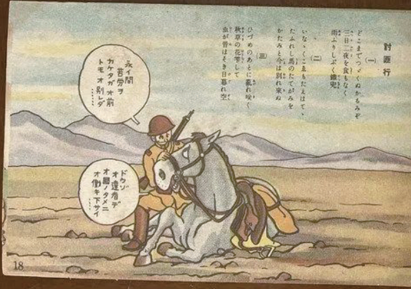
侵华日军第七三一部队罪证陈列馆征集的印有歌曲《讨匪行》的明信片

新华社消息 记者从侵华日军第七三一部队罪证陈列馆了解到,该馆与哈尔滨市木兰县联合赴日本征集一批日本侵华文献史料,包括印有歌曲《讨匪行》的明信片、战时照片等。