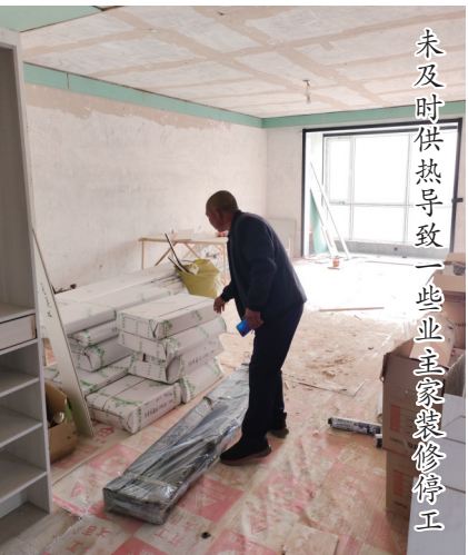
未及时供热导致一些业主家装停工

新报讯(草原全媒·北方新报首席记者 高志华) “我们是回民区西乌素图嘉园小区B1号楼业主,今年8月,我们在小区物业内蒙古中物物业服务有限公司领取钥匙时,物业代收了供热费,眼下到了供热季家里却没有暖气。我们找物业公司了解情况,物业总是以入住率不够,什么时候供热还得等上级通