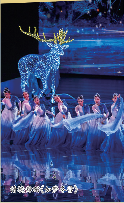
情境舞蹈《如梦冬雪》