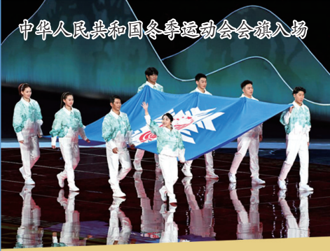
中华人民共和国冬季运动会会旗入场