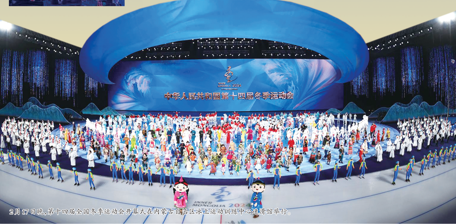
2月17日晚，第十四届全国冬季运动会开幕式在内蒙古自治区冰上运动训练中心速滑馆举行。