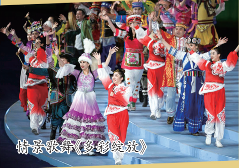
情景歌舞《多彩绽放》