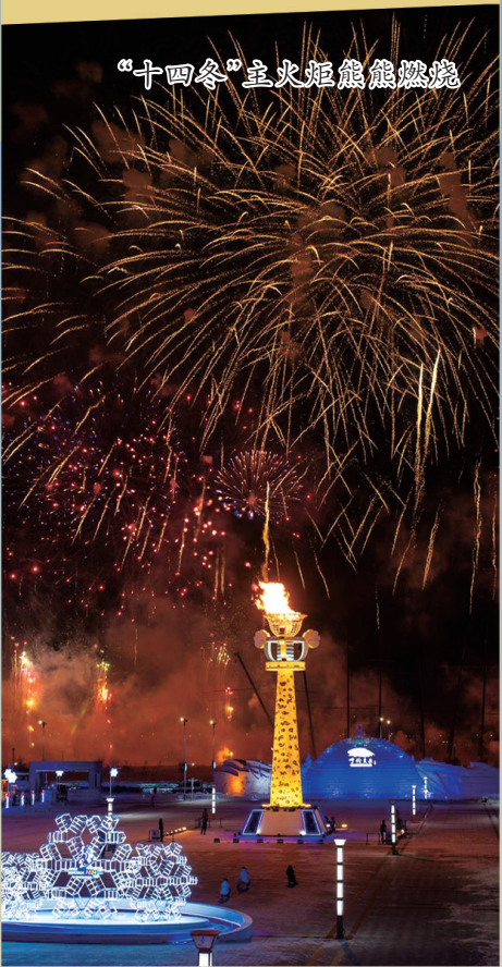
“十四冬”主火炬熊熊燃烧