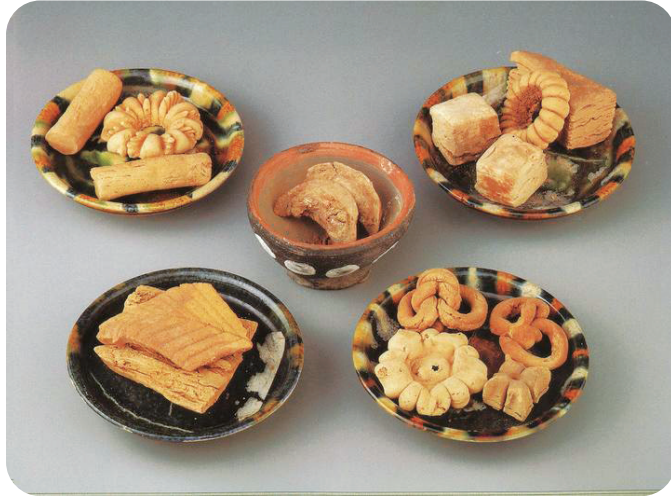
新疆出土的唐代点心及饺子