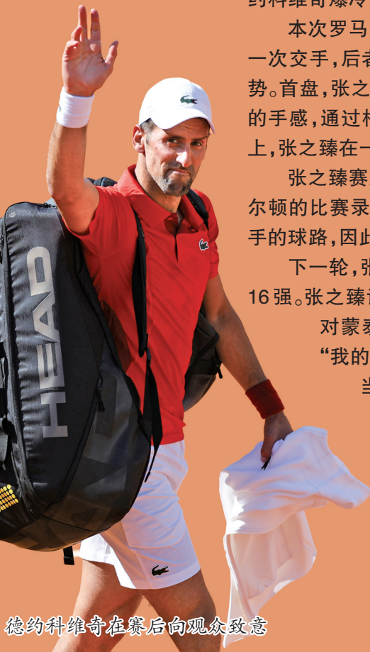
德约科维奇在赛后向观众致意