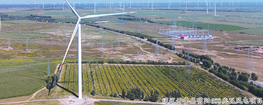
通辽开鲁县明阳600兆瓦风电项目