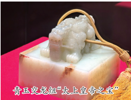
青玉交龙纽“太上皇帝之宝”