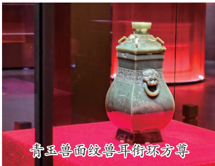
青玉兽面纹兽耳衔环方尊