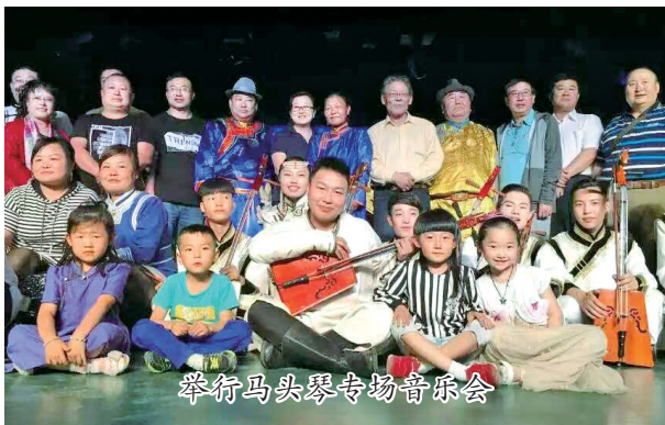
举行马头琴专场音乐会